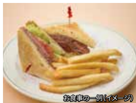
お食事の一例(イメージ)